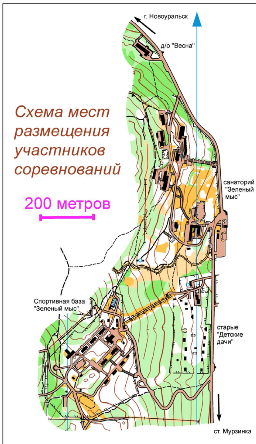
СХЕМА МЕСТ ПРОЖИВАНИЯ

В случае более раннего приезда команд вопросы по тренировочному полигону заблаговременно согласовывать с организаторами соревнований.